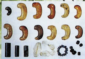
柏木古墳出土の玉類